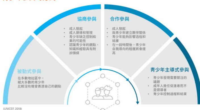
青少年參與的方式

聯合國兒童基金會 (UNICEF) 提出青少年健康參與的五個主要策略包括：(1) 青少年倡議：支持學生參與健康相關決策。(2) 世代對話：增進世代對話，邀請青少年參與健康計畫。(3) 支持環境：增能政府專家等提供青少年參與的友善支持環境。(4) 賦能青少年：增能青少年健康倡議，及提供健康促進服務等。(5) 參與平台：建立青少年參與線上與實體會議平台，及提供回饋的管道 (UNICEF, 2020)。青少年參與賦能 (empower) 有助於增進其溝通、問題解決、連結等生活技能 (UNICEF, 2020)。