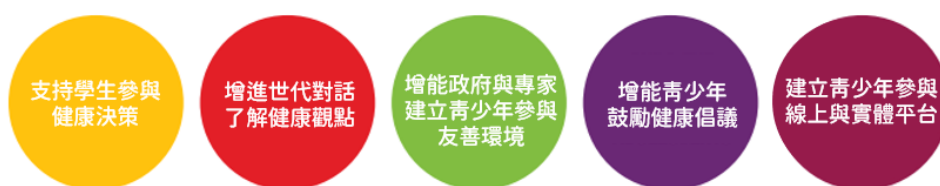
青少年參與及公民參與五個主要策略

聯合國兒童基金會 (UNICEF) 提出青少年健康參與的五個主要策略包括：(1) 青少年倡議：支持學生參與健康相關決策。(2) 世代對話：增進世代對話，邀請青少年參與健康計畫。(3) 支持環境：增能政府專家等提供青少年參與的友善支持環境。(4) 賦能青少年：增能青少年健康倡議，及提供健康促進服務等。(5) 參與平台：建立青少年參與線上與實體會議平台，及提供回饋的管道 (UNICEF, 2020)。青少年參與賦能 (empower) 有助於增進其溝通、問題解決、連結等生活技能 (UNICEF, 2020)。