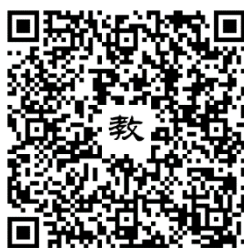
111 年活動教學模組指引連結

https://drive.google.com/file/d/1Jj54br7kdKy5Oj1n1YeOr7C9tJvPfwSG/view?usp=sharing