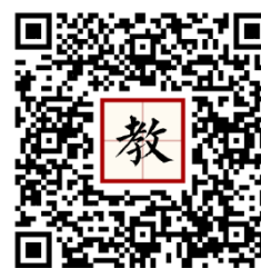
112 年活動教學模組指引連結