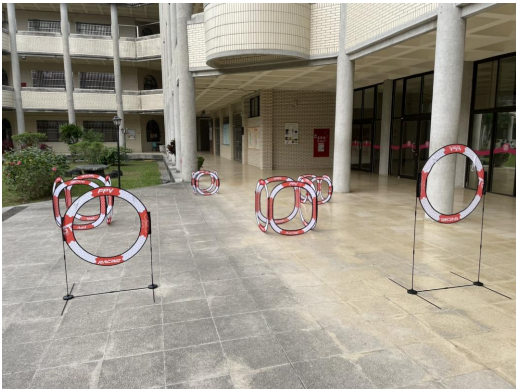
圖二 飛行路線示意圖